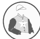
SÃO FRANCISCO DA SERRA