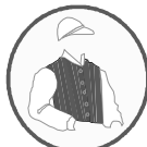
SANTA MARIA DE ARARAS