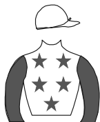
ITAPECERICA DA SERRA (VendaTotal de Plantel)